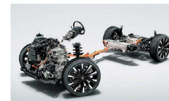
■写真は合成です。■写真はイメージです。■写真は停車状態のイメージです。■写真は機能説明のためにボディの一部を切断了カットモデルです。

最大トルク460N・mの2.4L直列4気筒 ターボエンジン+高トルクを引き出すモーター、 さらに後輪に搭載したeAxleを組み合わせた 新開発のパワートレインです。 アクセル操作に対する駆動力の遅れが少なく、 トルクフルで伸びやかな加速により、 爽快なドライビングフィールを実現。 また、リズミカルで気持ちのいい変速感も持ち味です。