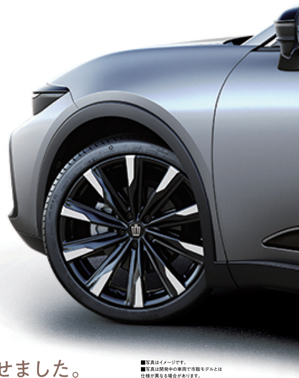
■写真はイメージです。 ■写真は開発中の車両で市販モデルとは仕様が異なる場合があります。

ボディ全体をリフトアップしながらも、負担を感じることなく乗り越えられる高さにサイドシル地上高を設定。腰の上下移動が少なく、「すっ」と乗り降りできるヒップポイントの高さとともに、足つきの良いサイドシル全幅、出入りしやすいドア開口の形など、細部に至るまで乗り降りのしやすさを追求しています。