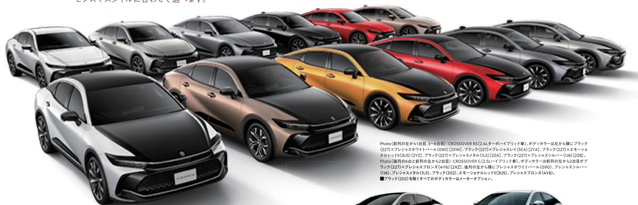
Photo (前列の左から1台目、3-6台目): CROSSOVER RS (2.4Lターボハイブリッド車)、ボディカラーは左から黒にブラック (22T)、プレジンスホワイトパール(090) [2XW]、ブラック(22T)×プレジンスホワイトパール(1J6) [2ZB]、エモーション ナルレットII(3US) [2Y2]、ブラック(22T)×プレジンスホワイトパール(1L5) [2Z4]、ブラック(22T)×プレジンスシルバー(1J6) [2ZB]。 Photo (後列の右と前列の左から2台目): CROSSOVER G (2.5Lハイブリッド車)、ボディカラーは前列の左から2台目がブ ラック(22T)×プレジンスホワイトパール(090) [2X2]、後列の左から黒にプレジンスホワイトパール(090)、プレジンスシルバー (1J6)、プレジンスホワイトパール(1L5)、ブラック(202)、エモーションナルレットII(3US)、プレジンスホワイトパール(1J6)。 ■ブラック(202)を除くすべてのボディカラーはメーカーオプション。