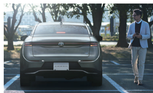
トヨタチームメイト*2[アドバンストパーク] ▶リモート機能 [CROSSOVER RS「Advanced」, CROSSOVER RSにメーカーパッケージオプション] *1. スマートフォン操作は、スマートキーを携帯したドライバーが行う必要があります。なお、デジタルキーのみを携帯し、アドバンストパーク(リモート機能)でのスマートフォン操作をすることはできません。*2. トヨタチームメイトは、商業の自動運転へとつながる新たな先進技術の総称です。 Photo: CROSSOVER RS「Advanced」(2.4Lターボハイブリッド車)、ボディカラーのプレジデンスメタル(L15)はメーカーオプション、オプション装着車。■写真は合成です。■写真は作動イメージです。■リモート機能のご利用には別途対応可能なスマートフォンが必要です。※機能やOSのバージョンによっては正常に作動しない場合があります。※動作確認用スマートフォンへのアクセスは https://toyota.jp/qapec/content/crown/012_p_001/5.0/pdf/spec/crown_ap_splinesup_202207.pdf よりご確認ください。