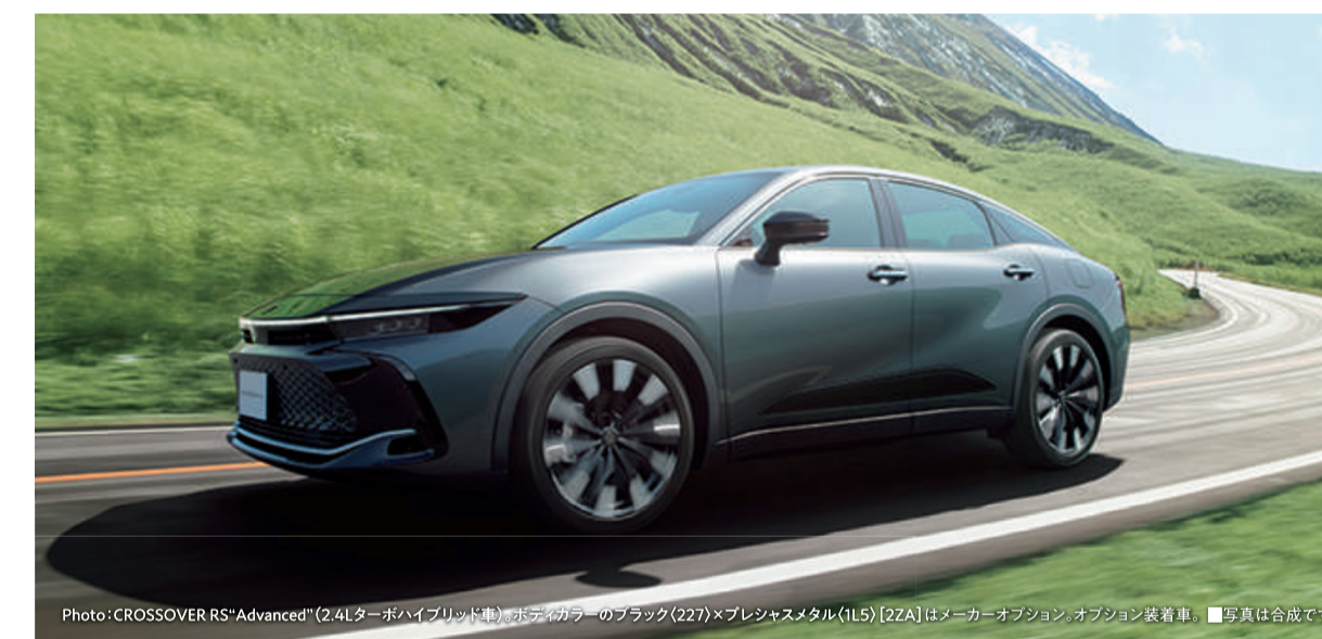
Photo: CROSSOVER RS「Advanced」(2.4Lターボハイブリッド車)ボディカラーのブラック(277)×プレシエスメタル(115) [27A]はメーカーオプション、オプション装着車。■写真は合成です。