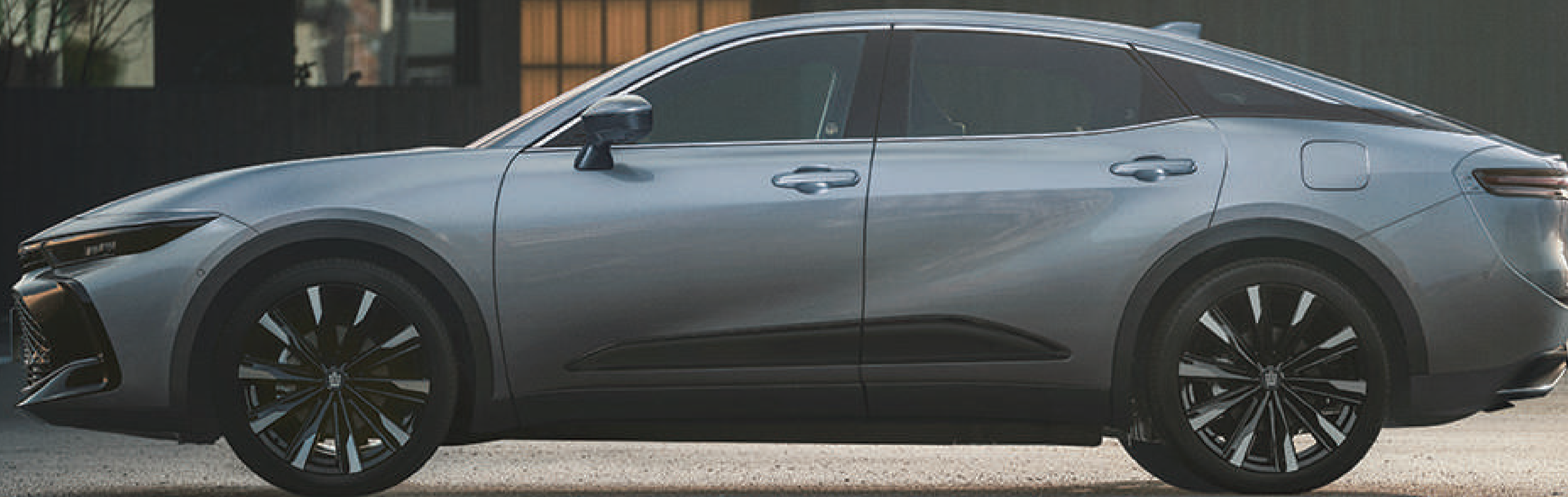
Photo: Crossover RS*Advanced (2.4Lターボハイブリッド車)、ボディカラーのプレシャスメタル(1L5)はメーカーオプション、オプション装着車。■写真は合成です。