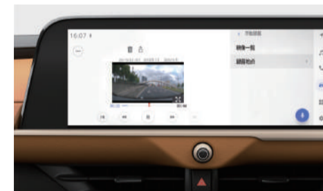
▶ドライブレコーダー(前後方) [CROSSOVER G「Advanced・Leather Package」, CROSSOVER G「Advanced」に標準装備, CROSSOVER RS「Advanced」, CROSSOVER RS, CROSSOVER G「Leather Package」, CROSSOVER Gにメーカーパッケージオプション] ■ドライブレコーダー(前後方)は事故の検証に役立つことを目的の一つとした製品ですが、証拠としての効力を保証するものではありません。■映像が録音された場合や録音されたファイルが破損している場合による損傷、故障や使用によって生じた損傷については、弊社は一切責任を負いません。■録音した映像は、その利用目的や使用方法によっては、第三者のプライバシーなどの権利を侵害する場合があります。ご注意ください。また、イタズラなどの目的では使用しないでください。これらの場合には弊社は一切責任を負いません。■詳細については取扱説明書をご覧ください。■録音映像(保存用)：後方180°(約10分) 録音容量：約200万画素(上下に黒帯が記録されるため、実映像は約130万画素となります。) 後方200°(約10分) 録音容量：約180万画素(上下に黒帯が記録されるため、実映像は約130万画素となります。) ■写真はイメージです。■録音映像のカメラ範囲はイメージです。