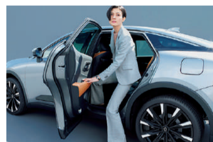
Photo: CROSSLAND RS "Advanced" (2.4Lターボハイブリッド車)。ボディカラーのフレッシュシルバー(116)はメーカーオプション。内装色はブラック/イエローブラウン。オプション装着車。

ボディ全体をリフトアップしながらも、負担を感じることなく乗り越えられる高さにサイドシル地上高を設定。腰の上下移動が少なく、「すっ」と乗り降りできるヒップポイントの高さとともに、足つきの良いサイドシル全幅、出入りしやすいドア開口の形など、細部に至るまで乗り降りのしやすさを追求しています。