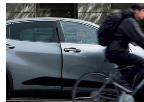
▶安心降車アシスト [SEA] [CROSSOVER Xにメーカーオプション, CROSSOVER Gにメーカーパッケージオプション, その他のグレードに標準装備] ■安心降車アシストの検知対象は歩行者と自転車のみで、自動車やバイクは検知されません。また、一部の特殊な道路状況等では、禁止物に対してもインジケーターが点灯する場合があります。■天候状態、道路状況、および車両状態によっては、ご使用にならない場合があります。■安心降車アシストはあくまで補助機能です。本機能を過信せず、降車の際はご自身で周囲の安全状況を確認してください。■写真はイメージです。