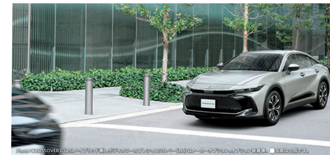
Photo: CROSSOVER G(2.5Lハイブリッド車)、ボディカラーのプレジデンスメタル(L15)はメーカーオプション、オプション装着車。■写真は合成です。

■運転支援機能のため、検知範囲、検知対象、作動速度には限界があります。必ず安全を確認しながら運転してください。■駐車環境や道路状況、交差点の形状、車両状態、天候状態、夜間およびドライバーの操作状態等によっては、システムが正しく作動しない場合があります。■安全運転や駐車を支援するシステムは、あくまで運転を支援する機能です。システムを過信せず、必ずドライバーが責任を持って周囲の状況を把握し、安全運転を心がけてください。■詳しくは取扱書やWEBまたは販売店でご確認ください。