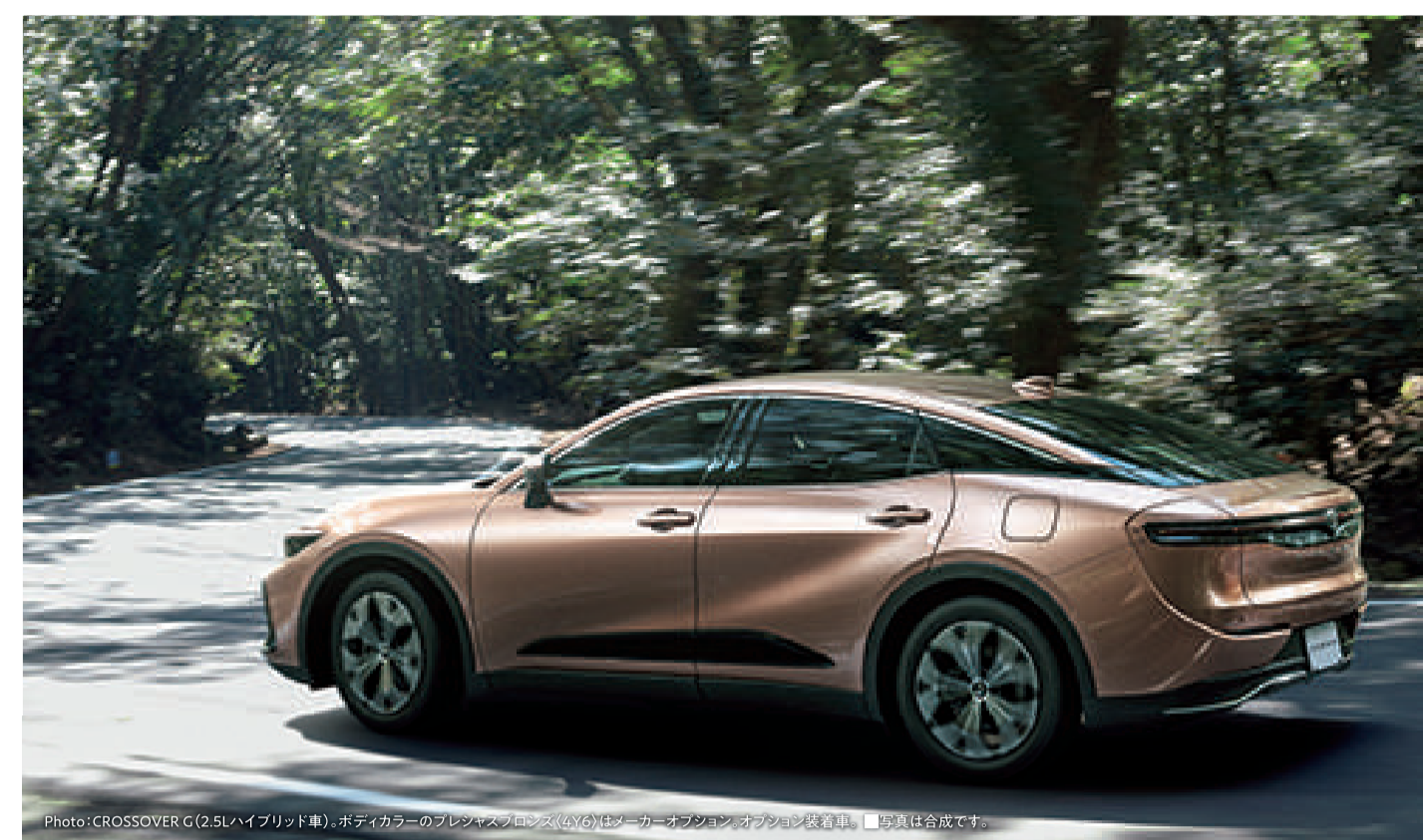
Photo: CROSSOVER G(2.5Lハイブリッド車)、ボディカラーのプレシエスフロンズ(AV6)はメーカーオプション、オプション装着車。■写真は合成です。

Answer より安定性に優れた「4WD」をベースに、 上質なハンドリングをつくり込みました。