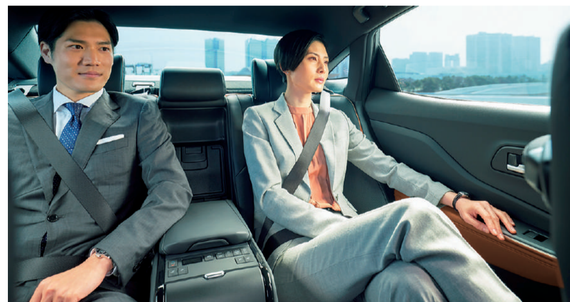
Photo: CROSSLAND RS "Advanced" (2.4Lターボハイブリッド車)。ボディカラーのブラック(227)×フレッシュシルバー(115) [22A]はメーカーオプション。内装色はブラック/イエローブラウン。オプション装着車。 ■写真は合成です。