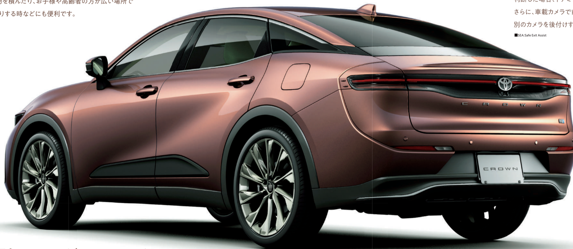
Photo: CROSSOVER G「Advanced・Leather Package」(2.5Lハイブリッド車)、 ボディカラーのプレジデンスメタル(4V6)はメーカーオプション。