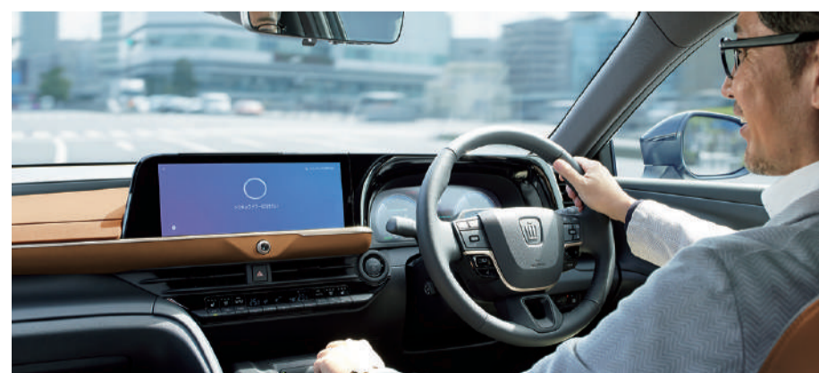
Photo: CROSSOVER RS「Advanced」(2.4Lターボハイブリッド車)、ボディカラーのブラック(227)×プレジデンスメタル(L15) [22]はメーカーオプション、内装色はブラック/イエローブラウン、オプション装着車。■写真は機能説明のために各ランプを点灯したものです。実際の走行状態を示すものではありません。■写真はイメージ合成です。

■T-Connectのご利用には、T-Connectの契約が必要です。また、専用通信機(DCM)が正常にデータ通信・音声通話できる場合にご利用いただけます。基本利用料は初年度登録日から5年間無料となります。*6年日以降は330円(消費税抜き300円)/月。