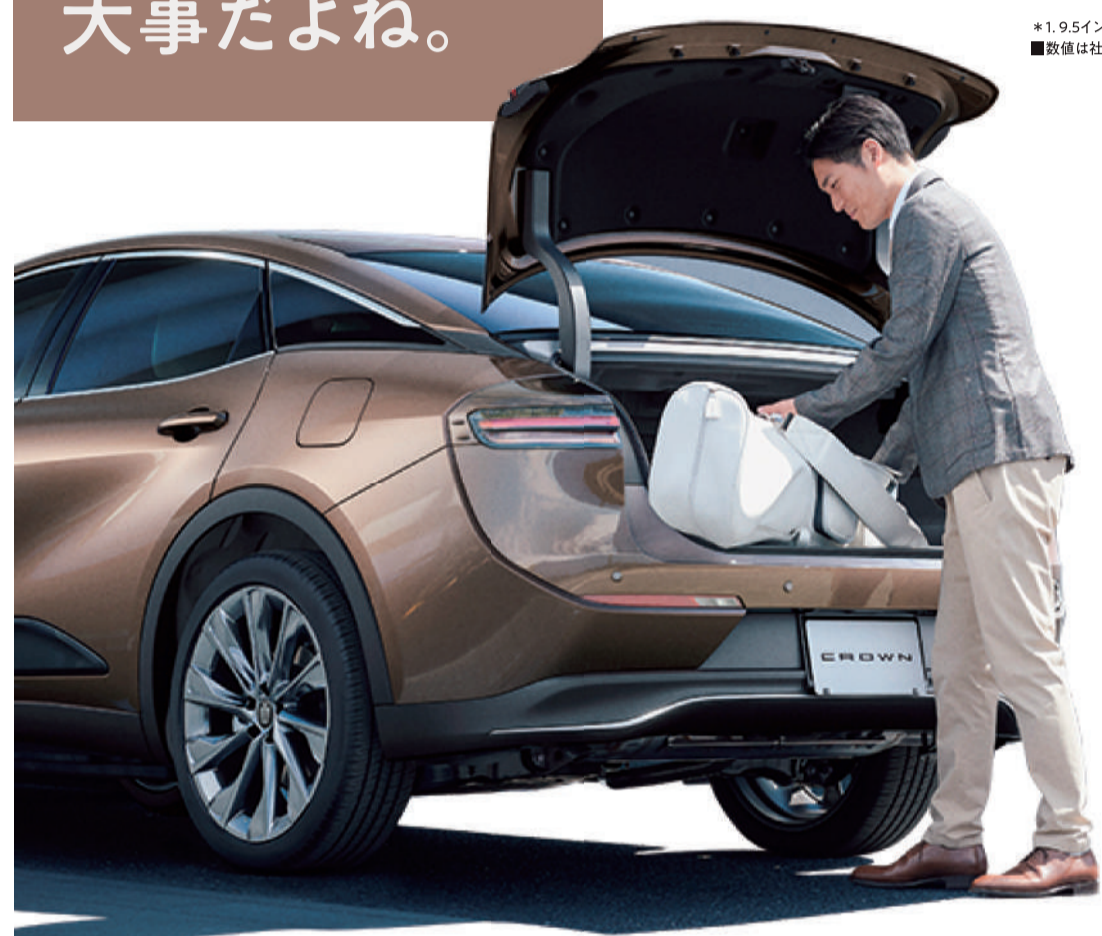
Photo: CROSSOVER G「Leather Package」(2.5Lハイブリッド車)、ボディカラーのプレシエスフロンズ(AV6)はメーカーオプション、オプション装着車。