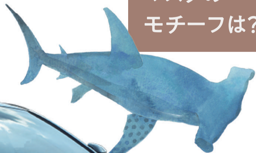
Photo: CROSSLAND RS "Advanced" (2.4Lターボハイブリッド車)。ボディカラーのブラック(227)×フレッシュホワイトパール(090) [2XW]はメーカーオプション。オプション装着車。 ■写真は合成です。

鋭さとワイド感を表現した、新しい概念のフロントフェイス。先端に位置する一文字のデイルイトが、シンプルな顔立ちをいっそう強調しています。そしてノーズには、シンプル&モダンになった王冠マークがさりげなく輝きます。