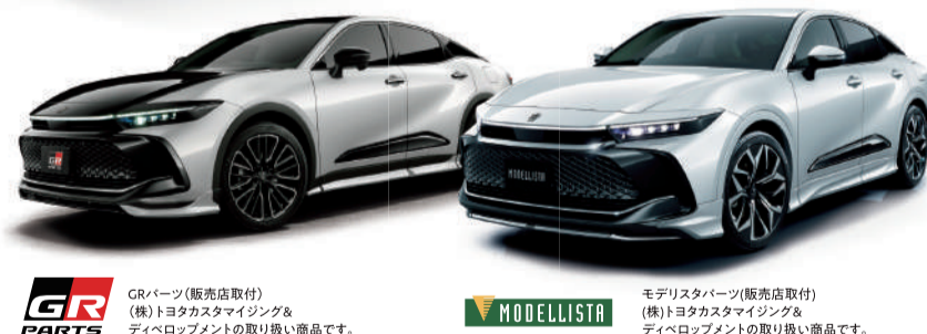
GR PARTS (GRパーツ) (販売店取付) (後) トヨタカスタマイズ ディベロップメントの取り扱い商品です。